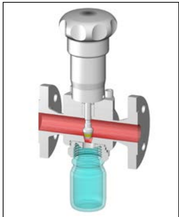
Princípio do assento cônico

Nosso departamento de P&D aliado a 30 anos de experiência na área nos permite encontrar soluções para os problemas de amostragem mais complexos.