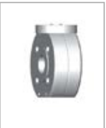
Tipo "Wafer" de aço inoxidável ou PFA