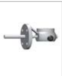
Lateral de Aço inoxidável