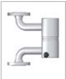
Vertical de aço inoxidável