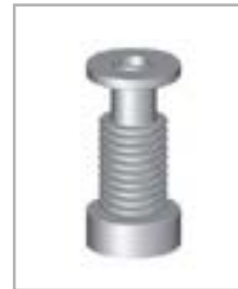
Extensão de arrefecimento