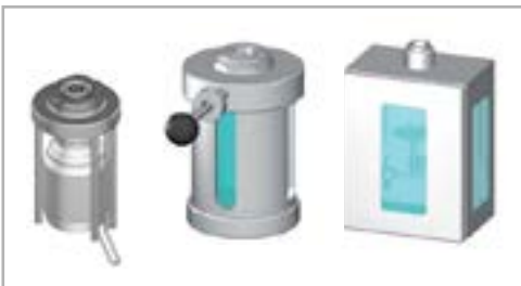
Receptáculos parcialmente fechados