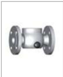
Horizontal de aço inoxidável ou PFA